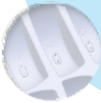
Labdisc şarj pinleri