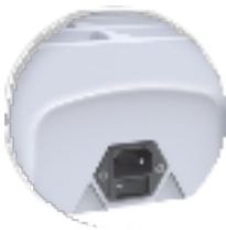
Tek güç girişi